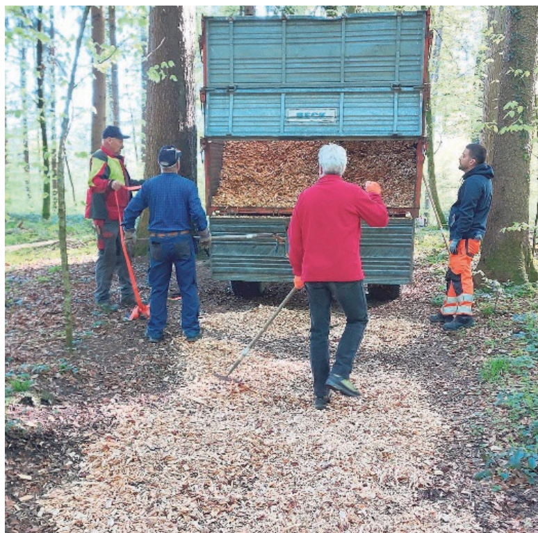
Hier wird die Laufbahn mit neuen Holzschnitzeln belegt.

Die Bodenflächen der insgesamt 14 Posten des Vitaparcours sind ab-