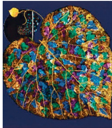
Objekt aus der Ausstellung.