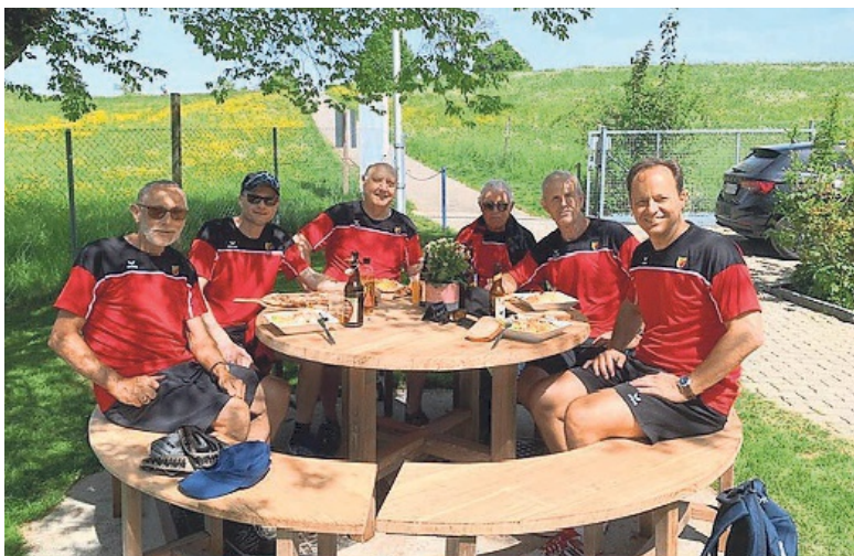
In der Badi am Hüttnersee genossen die Männerriegler das Mittagessen.