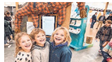
Schweizer Sagen, Rätsel und Mitmachmomente im Volkiland. BILD PD

16989 Franken. Darüber hinaus locken Überraschungspakete sowie Tausende Sofortpreise und Rabattgutscheine. (pd.)