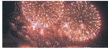
Keine Knallerei mehr erlaubt.

In Volketswil ist lärmiges Feuerwerk ab sofort ganzjährig verboten, auch am 1. August und an Silvester.