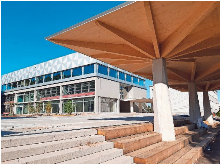
Trakt A mit Aufstockung, gedeckter Pausenplatz.