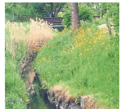
Der neue Gewässerplan für den Chimlibach liegt nun öffentlich auf.

Milla Winterberg, Lernende Jahrgang 2023–2026, wird per 1. Juli 2026 ihre Stelle als Zivilstands- und Bestattungsbeamtin (100 Prozent) antreten. Gemeinderat und Gemeindeverwaltung wünschen Milla Winterberg für ihre neue Aufgabe alles Gute und viel Erfolg. Fabian Rast, Materialwart und Schutzraumkontrolleur (100 Prozent), wird die Gemeindeverwaltung Volketswil per 31. Juli 2026 verlassen. Gemeinderat und Gemeindeverwaltung danken Fabian Rast für die geleisteten Dienste und wünschen ihm für die Zukunft alles Gute.