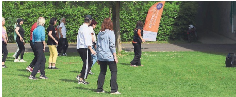
Bis Ende Juni können draussen wieder diverse Sportarten ausprobiert werden.

Seit 4. Mai laden die Gemeinde und die Gesundheitsstiftung Radix wieder zu Outdoor-Bewegung für alle ein. Acht Wochen lang kann Bootcamp, Yoga, Everdance und vieles mehr kostenlos und ohne Voranmeldung ausprobiert werden.