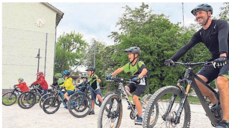
Spielerisches Aufwärmen beim Spiel «Bike-Monster».

Der Verein hat eine Rennrad-Gruppe, die sich donnerstags für Ausfahrten in der Region trifft. Immer dienstags von 18 Uhr bis 19.45 Uhr findet ab dem Sportplatz des Schulhauses Zentral das Jugend- und Aktivtraining statt. Dabei wird in Gruppen trainiert, die nach Alter und Können eingeteilt sind. So findet jede und je-