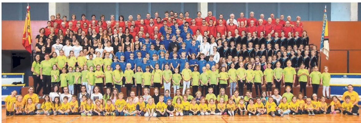
Die Turnriegen Volketswils im Jahr 2019 – sie sind neu im Turnverein Volketswil (TVV) zusammengeschlossen.