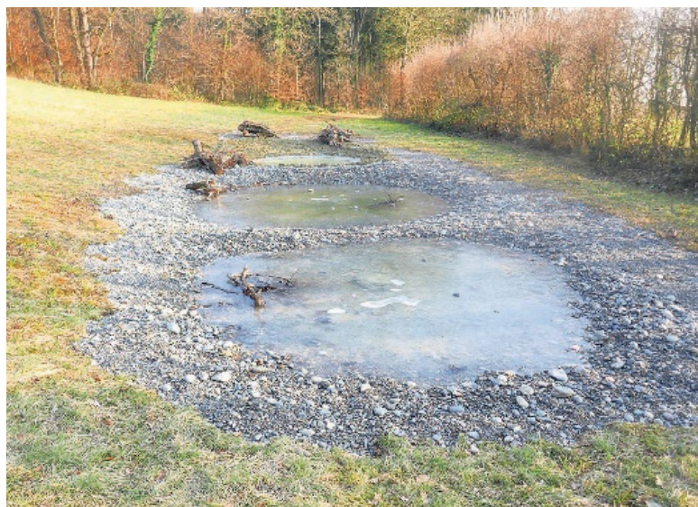
Schutzobjekt Erdbeerirain (Obj. 619): drei neue Kleingewässer, Vordergrund zwei Kiesgewässer, Hintergrund ein Lehmgewässer. Bild vom 18. 1. 2025.