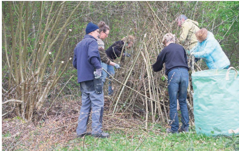
Freiwillige Helferinnen und Helfer packten fleissig mit an.

Wieselburgen sind künstlich angelegte Asthaufen, die speziell als Rückzugs- und Aufzuchtort für Wiesel – kleine, flinke Raubtiere – konzipiert sind. In der heutigen, oft stark aufgeräumten Kulturlandschaft finden Wiesel nur noch selten geeignete Verstecke. Wieselburgen bieten nicht nur Wiesel, sondern auch anderen Kleintieren wie Igel, Blind- und Insekten Schutz und Lebensraum. Sie tragen damit massgeblich zur Erhaltung der Artenvielfalt bei und unterstützen das öko-