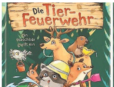
Lesespass bei der Feuerwehr.