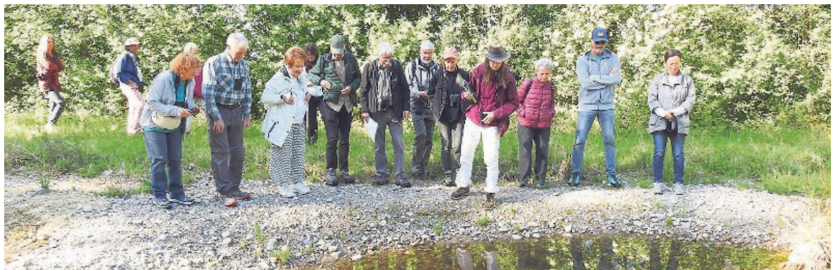
In den Teichen im Erdbeerirain leben Erdkröten und Bergmolche.

Eine Exkursion der IGLU führte die Teilnehmenden zum Erdbeerirain, wo die Gemeinde im Zuge der Biodiversitätsinitiative Amphibienteiche anlegte. Der Anlass war sehr gut besucht und die Teilnehmenden staunten über die Artenvielfalt in diesem Schutzgebiet.