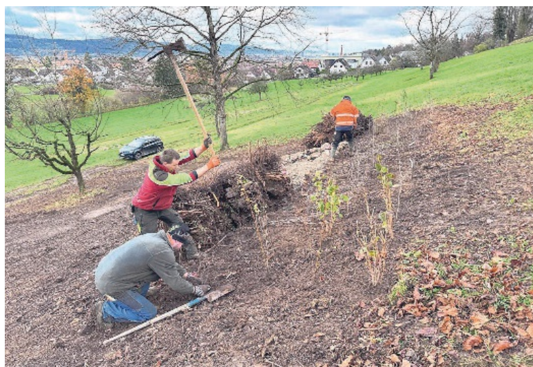
Kommunales Schutzobjekt 304 Trockenstandort Vorreben/Breiti: Heckenpflanzung oberhalb Strukturelemente. Bild vom 20. 11. 2025.

terschiedlich gestaltete und ablassbare Foliengewässer ersetzt. Amphibien wie der Bergmolch besiedelten die Gewässer danach umgehend. Auch Kaulquappen der Erdkröte sowie verschiedene Libellenarten und andere Gewässerinsekten konnten bereits wieder entdeckt werden.