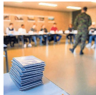
Bald ausgedient: Das Dienstbüchlein.

Genau diese Probleme sollen mit der Nachhaltigkeitsinitiative gelöst werden. Sie will die Bevölkerungsentwicklung wieder in eine geordnete und nachhaltige Bahn lenken, ohne die notwendige Zuwanderung von Fachkräften einzuschränken. Darum ist ein Ja zur Nachhaltigkeitsinitiative (e.)