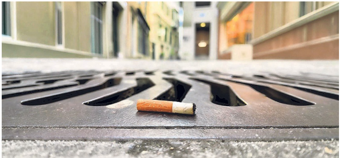
14 Jahre dauert es, bis ein Stummel zu schädlichem Mikroplastik zerfällt.

Zigarettenstummel sind giftig und aus Plastik. Sie gehören in den Ab-