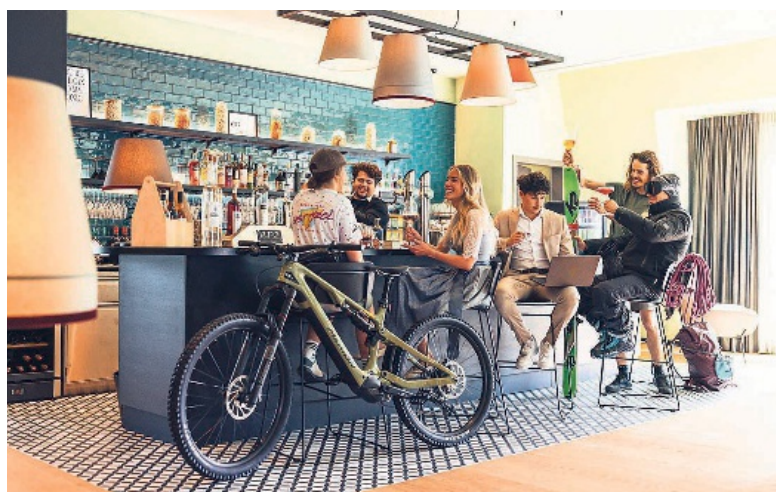
Blick in harry's Wohnzimmer.

Durch die gute Anbindung, digitale Check-ins und eine Ausstattung, die je nach Standort von Kinderspielzimmern bis hin zu Saunen reicht, wird harry's home zum idealen Zuhause auf Zeit – für Aktivurlauber, Familien, Geschäftsreisende und City-Nomaden gleichermaßen. In