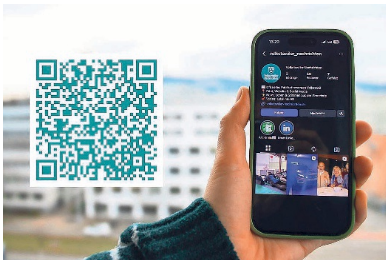
Den QR-Code scannen und direkt auf unserem Insta-Kanal landen.

Damit unsere Kanäle das Gemeindeleben noch breiter abbilden,