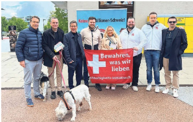
Standaktion der SVP bei der Post in Volketswil.

Ein zentrales Thema an der Standaktion war der häufig genannte Fachkräftemangel, insbesondere im Gesundheitswesen. Viele befürchten, dass bei einer Annahme der Initiative zu wenig Personal zur Verfügung stehen könnte. Diese Sorge ist jedoch unbegründet. Gemäss NZZ wanderten 2024 rund 2900 Ärztinnen, Ärzte und Pflegefachpersonen in die Schweiz ein – das entspricht weniger als drei Prozent der gesamten Erwerbszuwan-