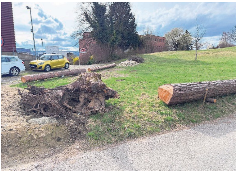
Schutzobjekt Trockenstandort Oetenbüel (Obj. 703): Wurzelstock, Baumstämme, Sandlinie und Steinhaufen zum Verhindern des wilden Parkierens. Bild vom 11. 3. 2025.