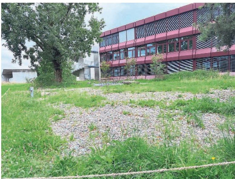
Aufwertung Schulhaus Lindenbüel: neu angelegte Ruderalfläche. Bild vom 4. 8. 2025.