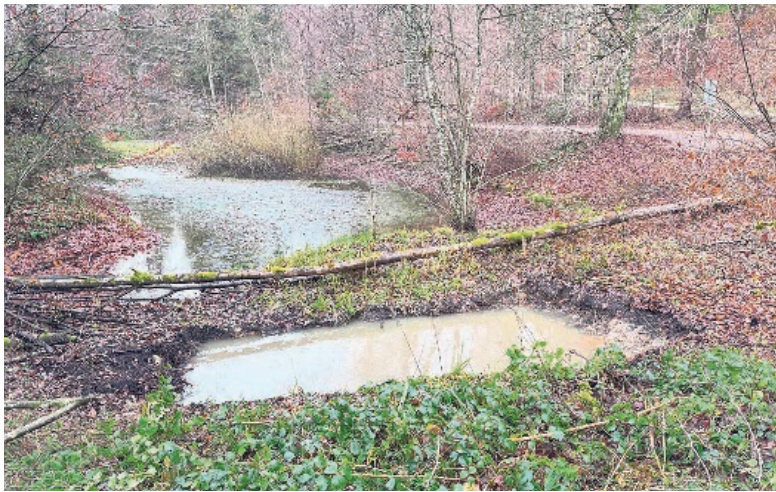
Schutzobjekt Waldacher/Tiergartenweg (Obj. 601): Kleingewässer neu ausgehoben, Ufer ausgelichtet. Bild vom 25. 11. 2025.

ammlung deutlich angenommene Biodiversitätsinitiative um. ckelt, neue Lebensraumangebote werden rasch besiedelt.