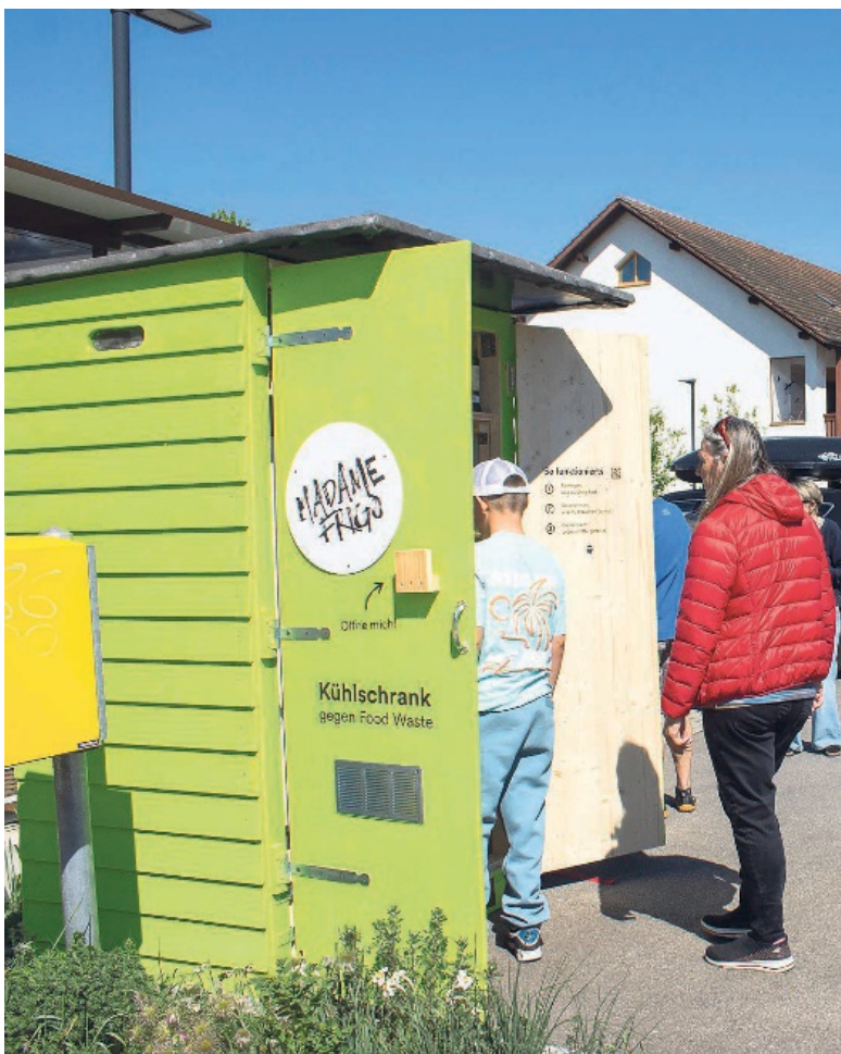
Madame Frigo im GZ in der Au bei der Bushaltestelle – rund um die Uhr geöffnet.