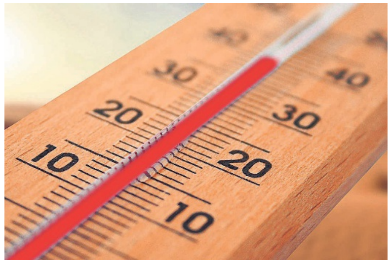
Die Sommerhitze ist eine oft unterschätzte Gefahr.