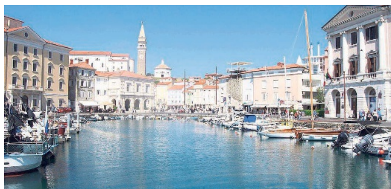
Blick über die Hafepromenade auf die slowenische Stadt Piran.

Infos: Wanderzeit 3 Stunden für 10,5 Kilometer, 394 m Auf- und 218 m Abstieg (W3+). Treffpunkt ab 6.45 in Schwerzenbach auf dem Perron, Abfahrt 7.02 Uhr. Die Billette besorgt der Wanderleiter, Fahrpreis 87.50 mit Halbtax (ab 10 Personen 61.30). Rückkehr in Schwerzenbach voraussichtlich um 19.28 Uhr. Wer mag, kann statt des üblichen Schlusstrunks auch ein kleines Nachtessen im «Stazione» einnehmen. Anmeldung an den Wanderleiter bitte bis Samstag, 30.5. (mit Angabe von Bahn-Abo, mit/ohne Gipfeli). Eine Absage würde am Vortag des Anlasses erfolgen. Organisation: Harald Gattiker (Anmeldung bitte per Mail an harald.gattiker@senig.ch, sonst 079 625 41 43 auf Combox).