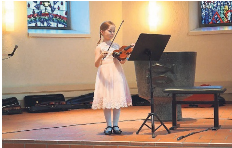
Schülerinnen und Schüler der Musikschule Volketswil zeigen am 4. Juni ihr Können.

Schülerinnen und Schüler aus Volketswil haben mit ihren Blas-, Tasten- und Saiteninstrumenten ein abwechslungsreiches Konzert vorbereitet. Auf den Instrumenten Gitarre, Klavier, Violine, Akkordeon, Violoncello, Querflöte, Oboe sowie Liedern mit dem Kinderchor werden Musikstücke in verschiedensten Stilrichtungen vorgetragen. Die jungen Musikerinnen und Musiker freuen sich schon jetzt auf Ihren Besuch. Der Eintritt ist frei. (e.)