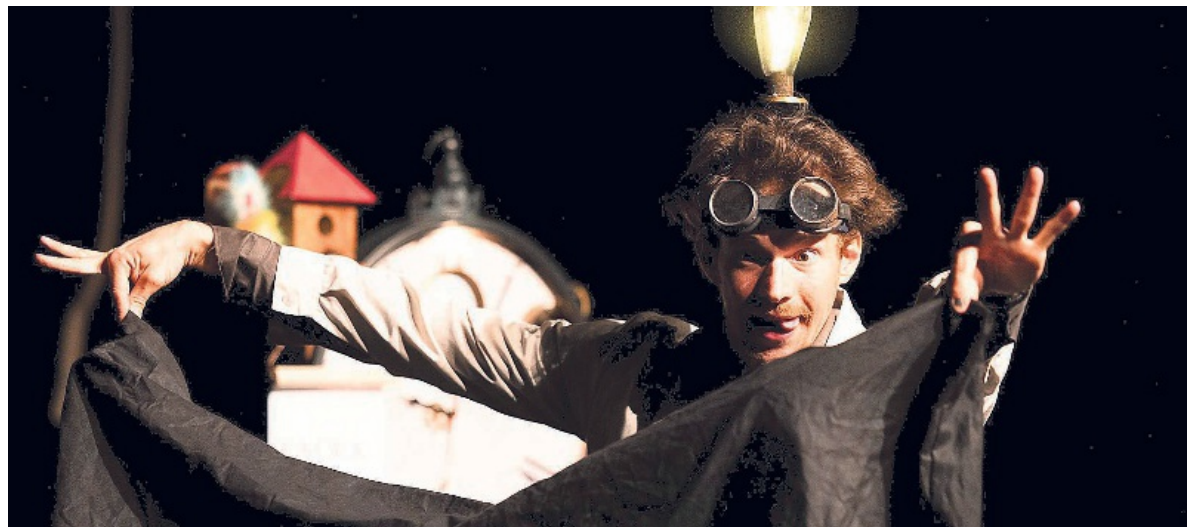
Professor Knallkopf, der schrullige Erfinder aus dem 19. Jahrhundert, bringt seine verrückten Experimente nach Volketswil.