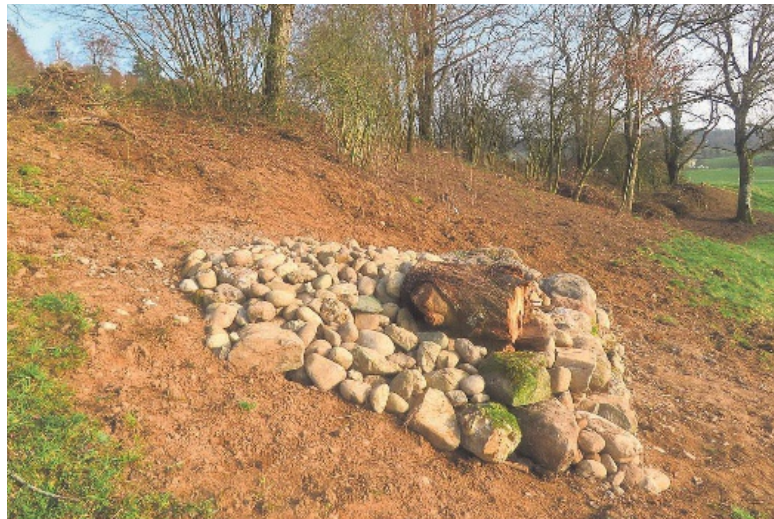
Neu angelegter Steinriegel im kommunalen Schutzobjekt 145 Trockenstandort Reben/Widenacher, Bild vom 29. 2. 2024.

Ein weiteres grösseres Aufwertungsprojekt betraf das kommunale Schutzobjekt Trockenstandort Erdbeerirain zwischen Volketswil und Kindhausen. Hier wurde ein verlandetes und undichtes Gewässer saniert beziehungsweise durch drei neue, un-